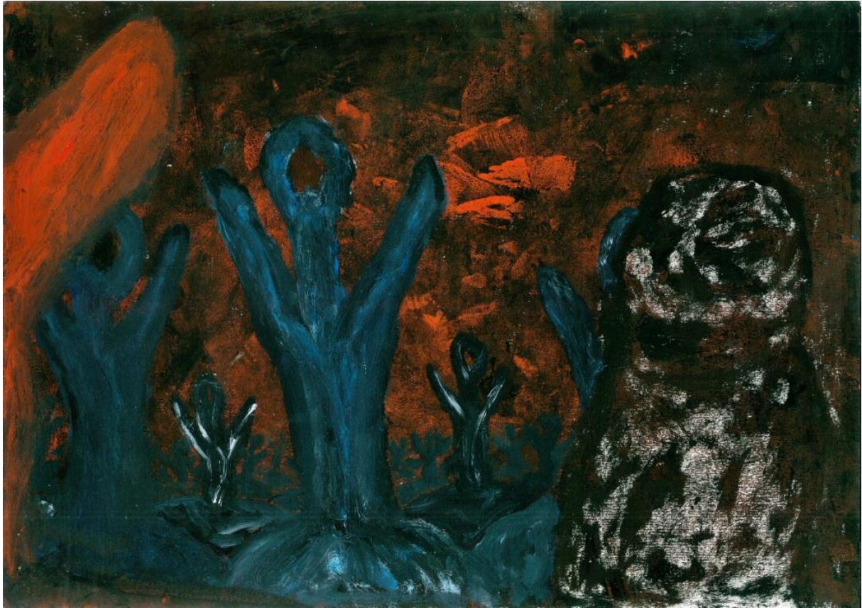
blume (michael johann bauer): der seher (2014). druckfarben mit pinsel auf papier.