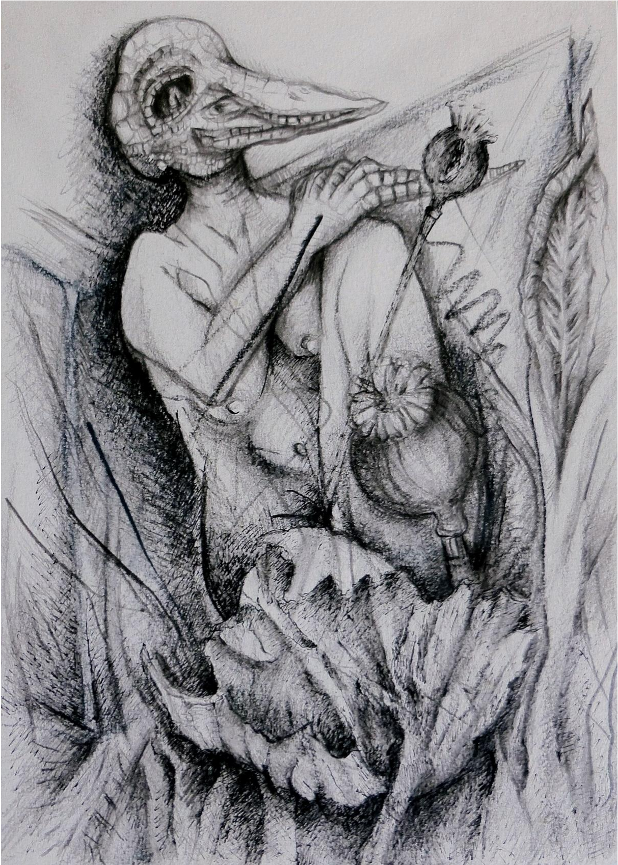
Irene Klaffke: Im Gras (1998). Federzeichnung/schwarzer Buntstift.