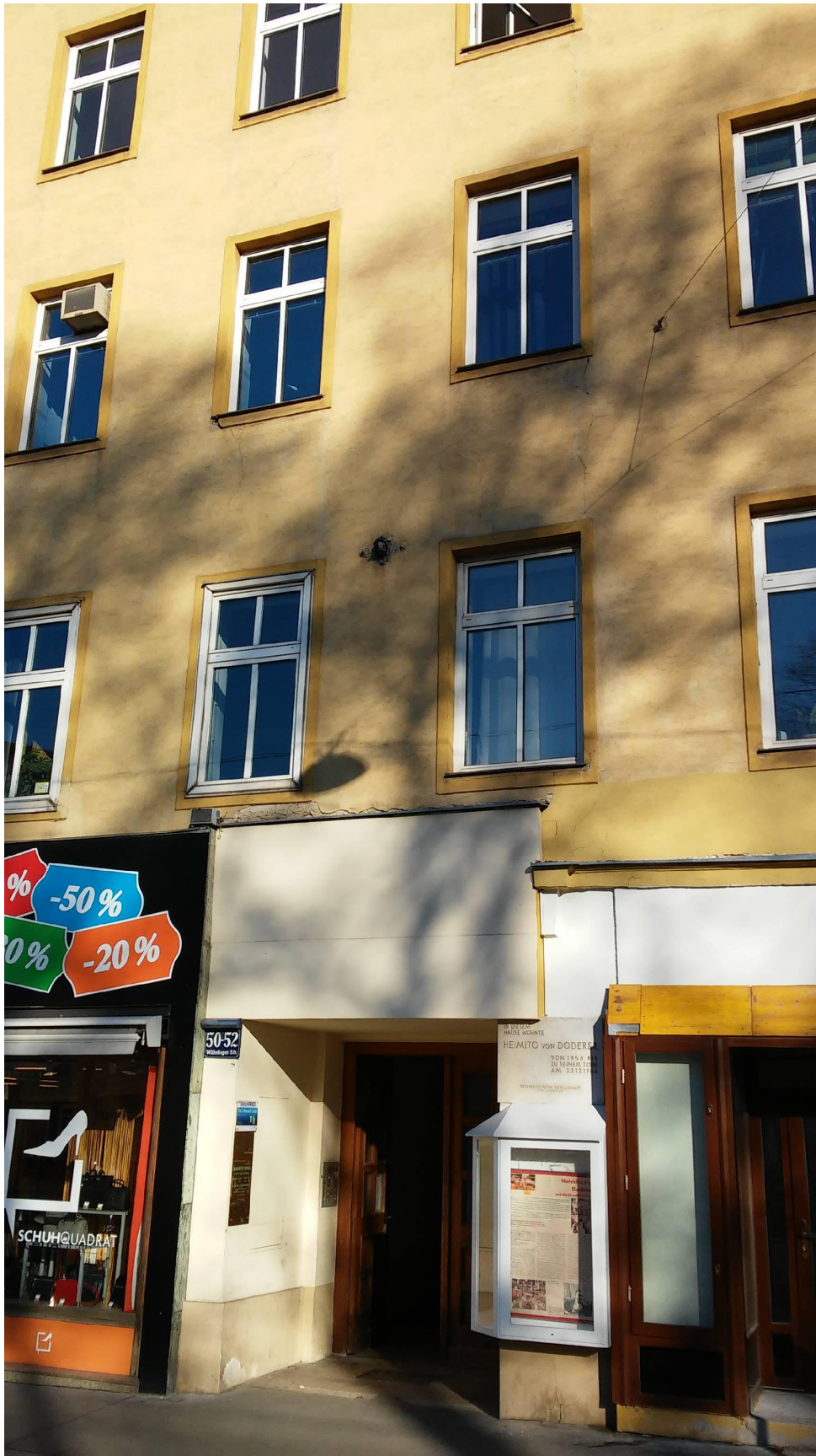
Heimito von Doderers letztes Wohnhaus in Wien (2016).