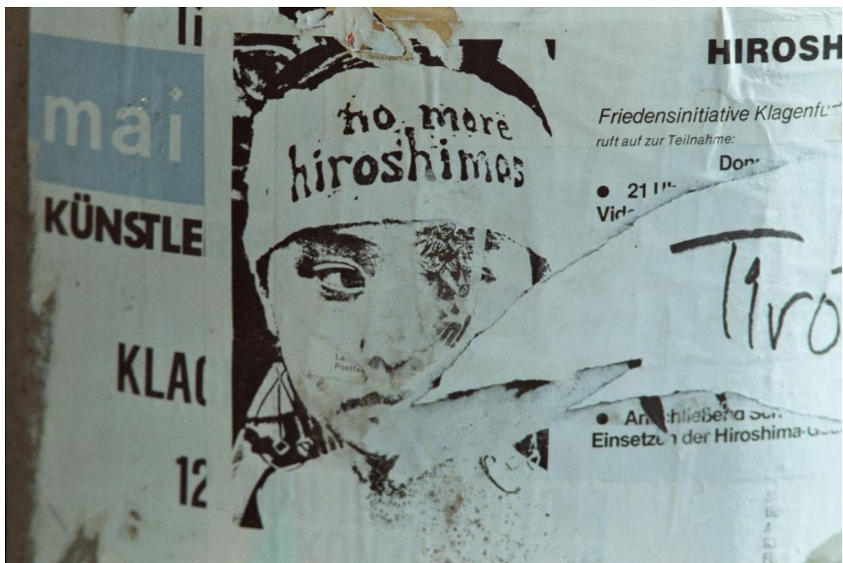
Peter Paul Wiplinger: No more Hiroshima. Aus der Foto-Serie „Plakatreste“ (Klagenfurt 1995).