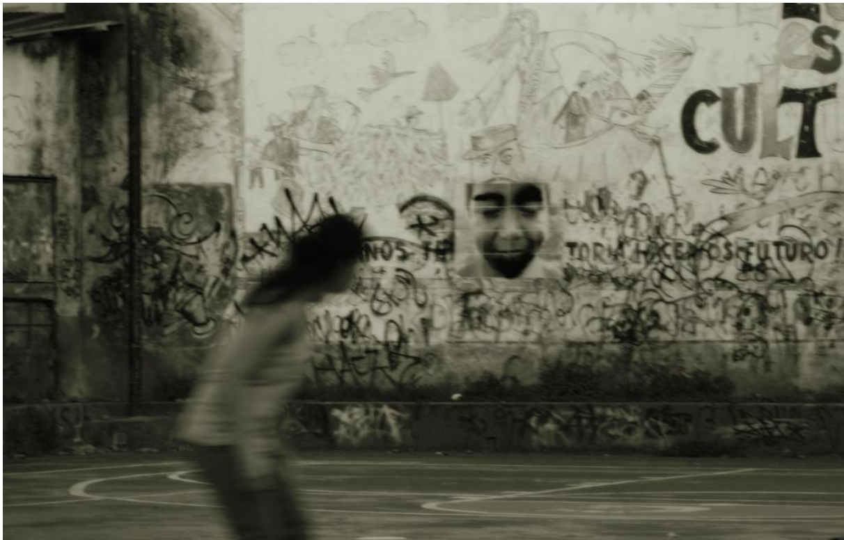
Mädchen am Skateboard, León.