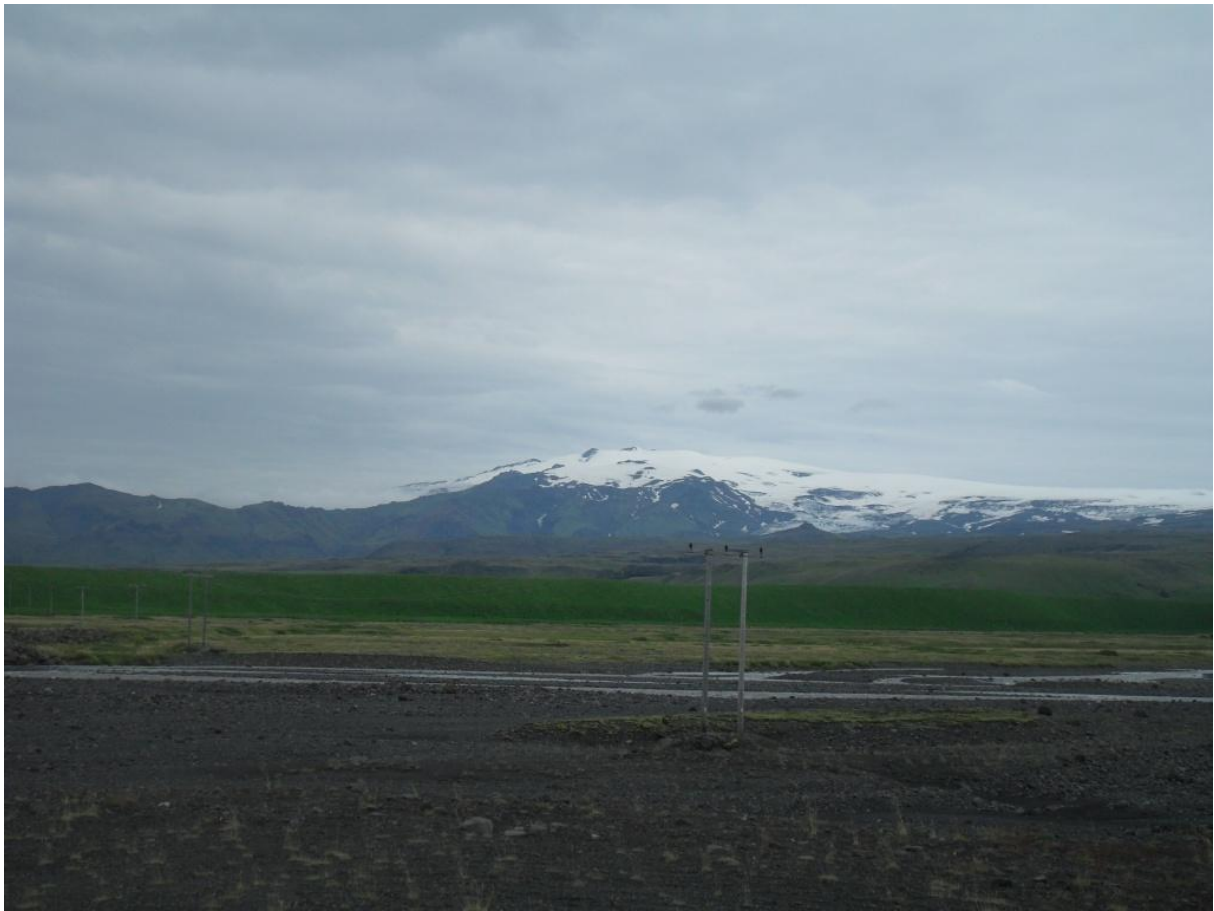
Blick auf den Eyjafjallajökull (2014).

Das führt mich zu einer Frage, die mit Ihrer jetzigen Tätigkeit als Touristikunternehmerin und Reiseleiterin zusammenhängt: Allgemein kann man glaube ich sagen, daß unsere Zeitgenossen schon auf mittelgroße Katastrophen nicht eingestellt sind, schon ein längerer Schneefall führt manchmal zu Ausnahmezuständen. Erleben Sie das auch so im Reisealltag, daß die Leute sozusagen in die Natur stolpern?