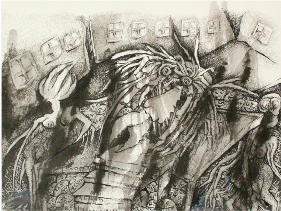
Irene Klaffke: Stufen zerbröckeln (2010). Lavierte Federzeichnung.