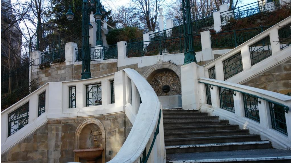
Die Strudlhofstiege in Wien (2016).