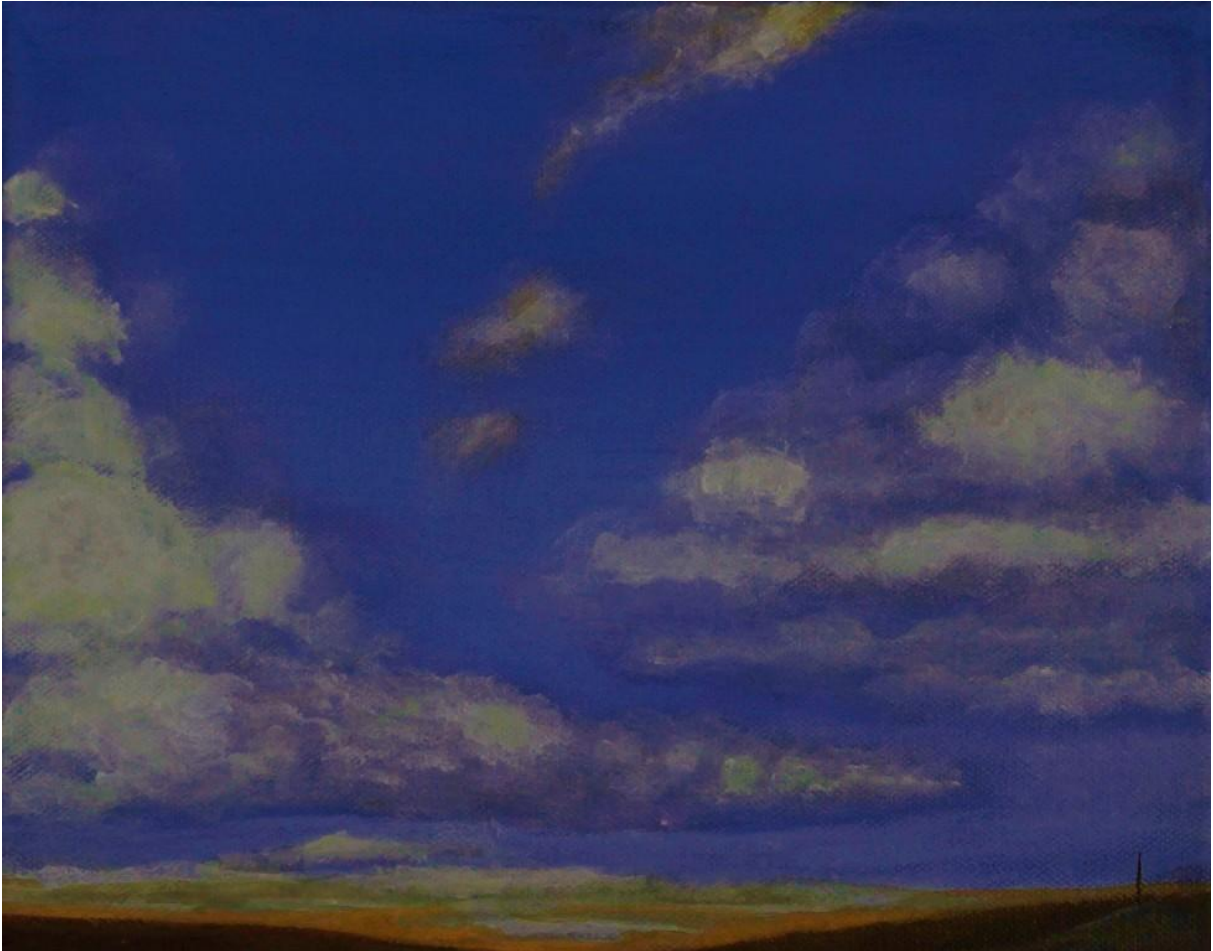
Stefan Schneider: Off der Hie (2015). Acryl. Aus der Serie „Wolken über Übernthal“.