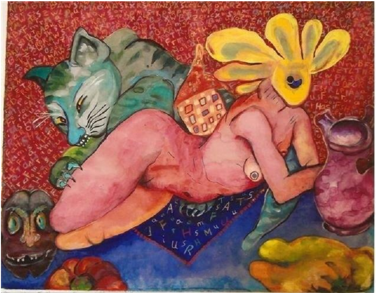
Irene Klaffke: Das Frühstück (2011). Aquarell und Mischtechnik.