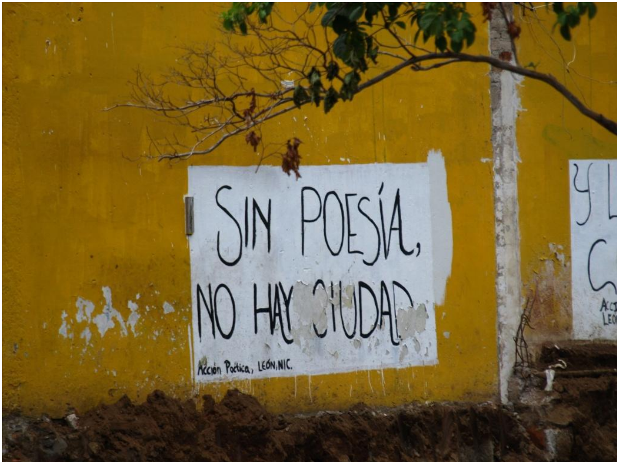
Park der Poeten in León – Ohne Poesie keine Stadt.